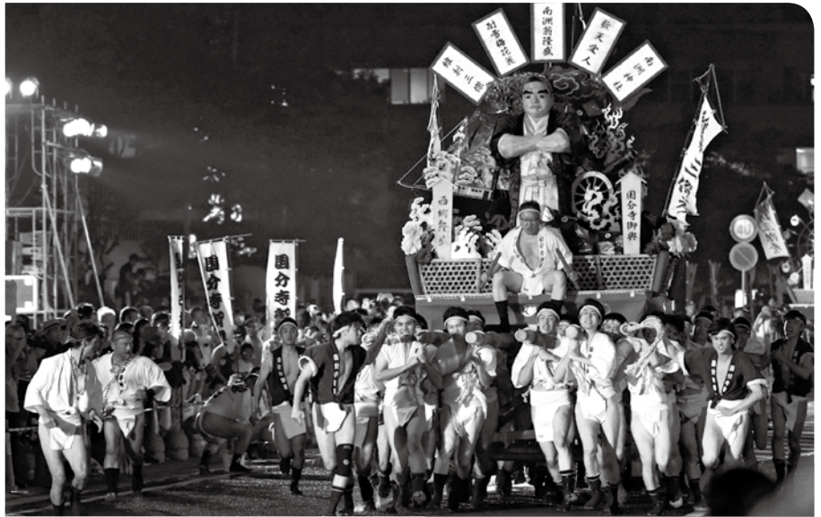
昨年の霧島国分夏まつりの様子