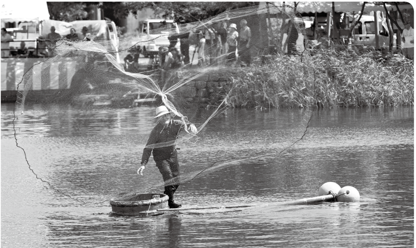
網の花が開くような投網漁