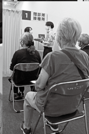
集団接種会場の様子