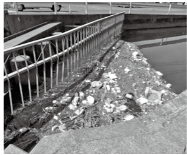
ごみがたまった用水路

用水路の「ごみゼロ」にご協力を 用水路には、水を水田に流す役割があります。ビニール袋、空き缶、ペットボトルなどのごみがほい捨てされたり、草刈り後の草が流されたりして用水路がふさがり、水があふれる事案が発生しています。 水が田んぼに流れず稲の生育に影響が出たり、道路が水浸しになったりするなど地域住民も不快な思いをしています。ごみはほい捨てせず、刈り草は適正に管理しましょう。用水路をきれいに維持できるように、皆さんの協力をお願いします。 問=耕地課 ☎(64)0911