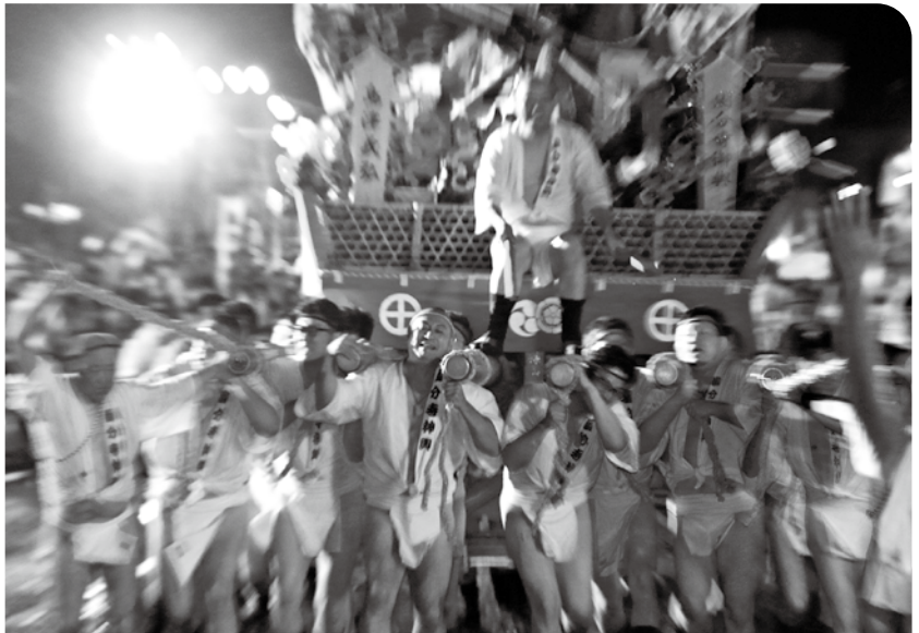
霧島国分夏まつりの様子(令和元年)