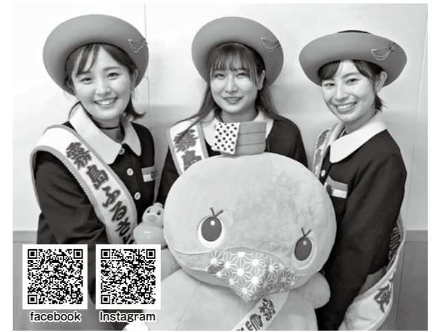
第15代霧島ふるさと大使の皆さん

引継式から約1年間、市の魅力をPRするため、市内外で開催される観光宣伝や物産展、姉妹都市交流行事など各種イベントに参加していただきます。 たくさんのお会いもあり、貴重な経験を積むことができます。ぜひ応募ください。