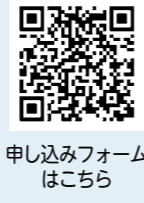
申し込みフォームはこちら