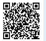
詳細はこちらから