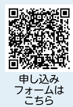
申し込みフォームはこちら

● 場所 上野原縄文の森体験学習館 ● 対象 小学1～3年生と保護者 ● 定員 15組 ● ※申し込み多数の場合は抽選。 ● 参加料 550円/組 ● 申込期間 10月2日(月)～11月2日(木)