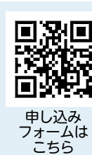
申し込みフォームはこちら

結婚を希望する人に出会いのきっかけをつくる出張窓口を開設します。入会登録や登録会員情報の閲覧、お見合いの申し込みができます。 ● 日時 10月8日(日) 午前9時50分～午後3時10分 ● 場所 国分公民館中研修室 ● 対象 20歳以上の独身 ● 定員 11先着10人