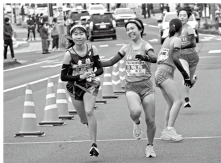
たすきをつなぐ始良チーム