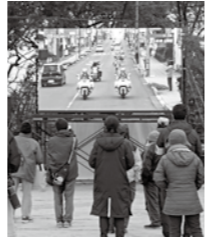
レースを見守る観客ら