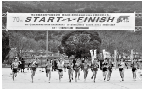
凜とした空気の中でスタート