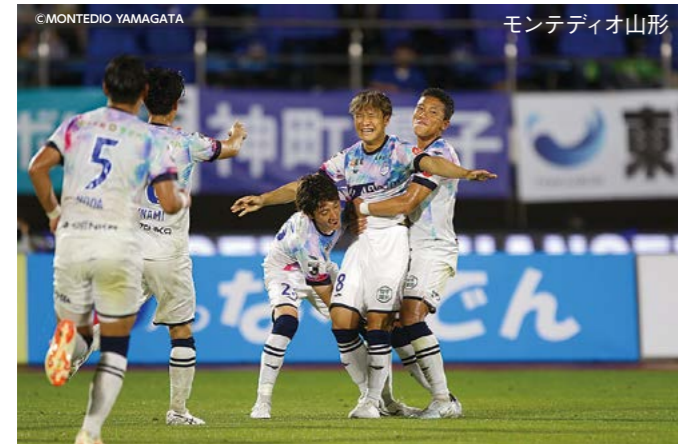
モンテディオ山形

※練習試合などの日程は調整中です。詳細は問い合わせるか市ホームページをご覧ください。