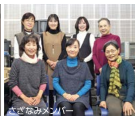
さざなみメンバー

・FMきりしま 音訳ボランティア「さざなみ」のメンバーが読み上げた広報きりしまを、FMきりしまで放送します(毎週土曜)。