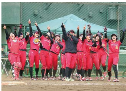
太陽誘電女子ソフトボール部