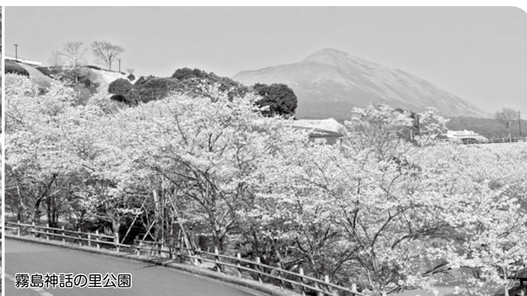
霧島神話の里公園