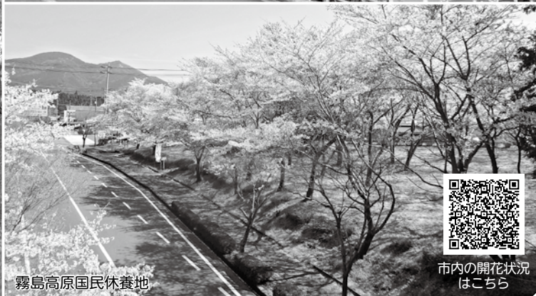
霧島高原国民休養地