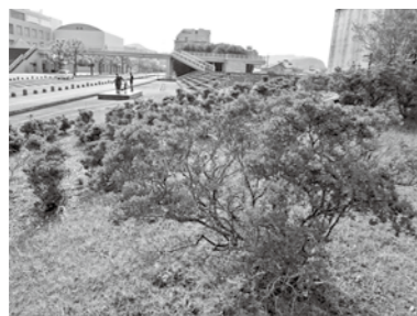
国分シビックセンター前のキリシマツツジ