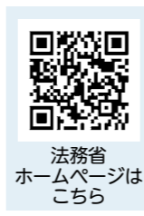
法務省ホームページはこちら

なお、令和8年4月1日届け出分から適用されます。法改正に関する詳細は、法務省ホームページをご覧ください。