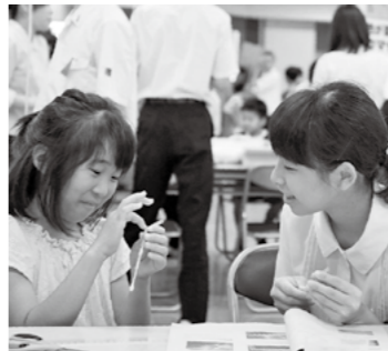
昨年のサイエンスフェスタ

国分高校理数科の生徒と一緒に、スライムや人工イクラなどを作りませんか。 ●日時 7月2日(土) 午前10時～午後2時 ●場所 伊オン単人国分店2階イオンホール ●対象 小中学生