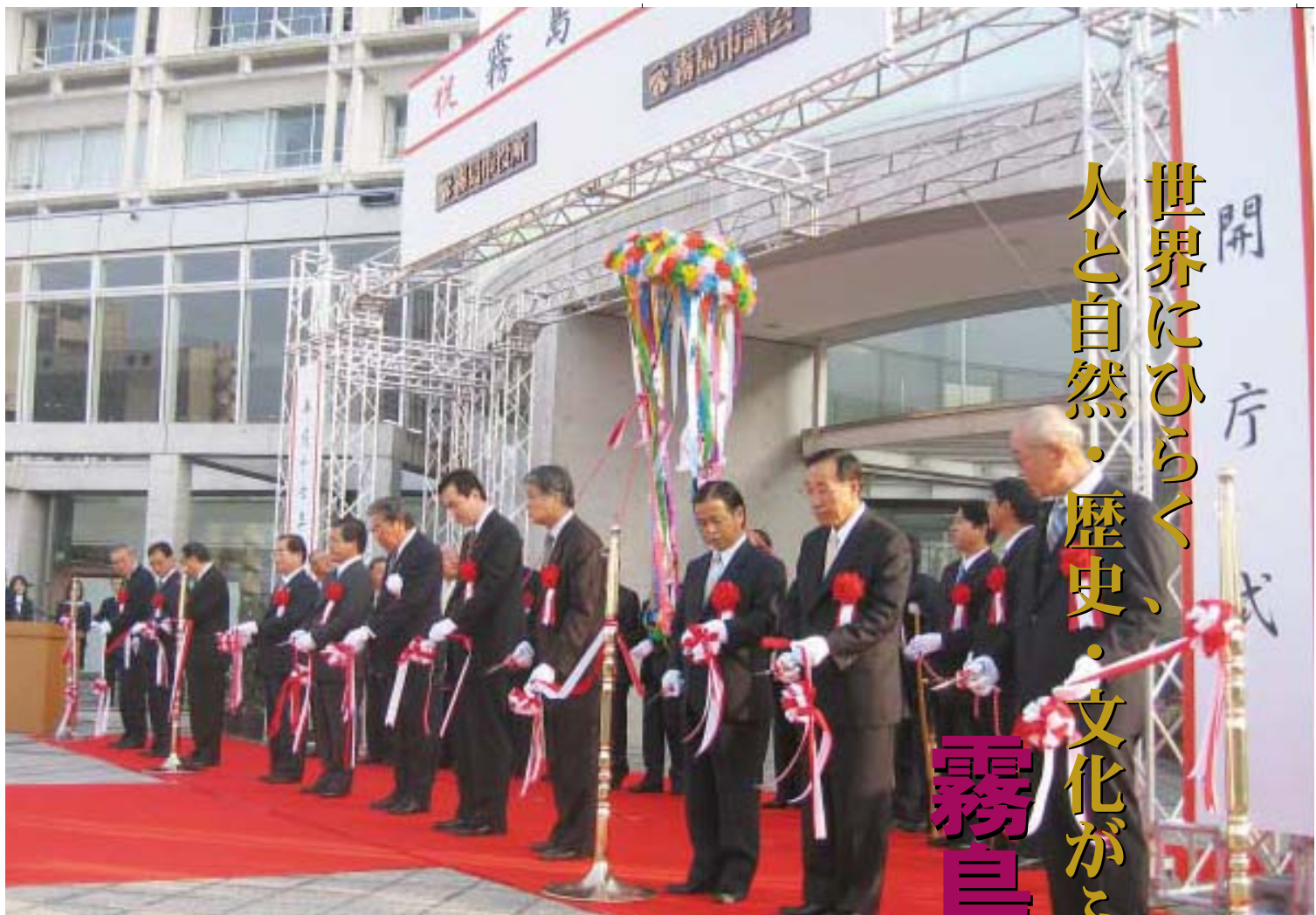
▲11月7日、霧島市役所(旧国分市役所)玄関前で開庁式のテープカット