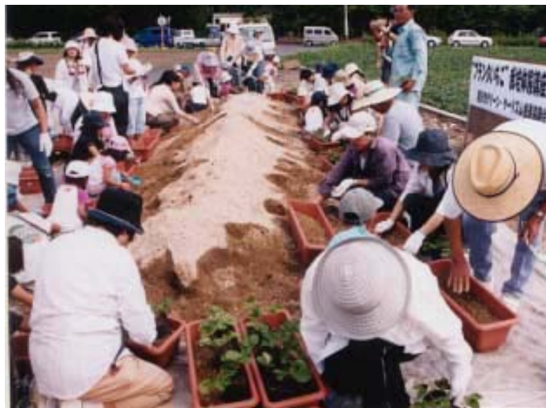
▲いちご栽培に取り組む参加者

10月1日、春山(国分)の観光農園の、竹ノ内農園と吉村農園で国分では初の試みとなる、グリーンツーリズム事業による農業体験が行われました。プランタいちご栽培体験講座があり、事前に申し込みをした64家族、140人余りが参加し、プランタにいちごの苗を植え込んだり、いちご栽培の話を聞くなど農家とふれあいを深めました。