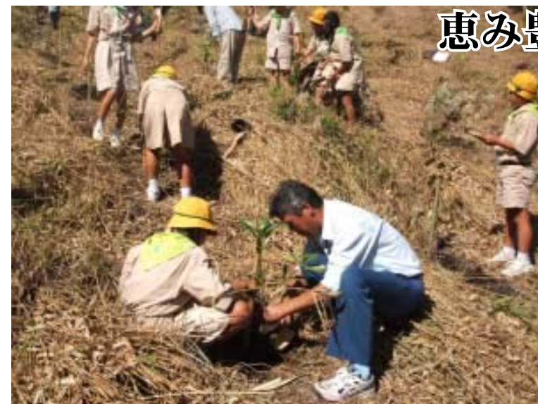
▲恵み豊かな森林を願い植樹する参加者

10月16日、平成17年度始良地区植樹祭が緑の回廊、轟木の滝公園（牧園町）で開催されました。式典では、始良地区の森林・林業功労者への表彰の後、「間伐等の森林整備を推進し、恵み豊かな森林づくりを進め、地球温暖化防止に貢献しよう」をはじめとした植樹祭スローガンが宣言されました。また、参加者全員により「イ