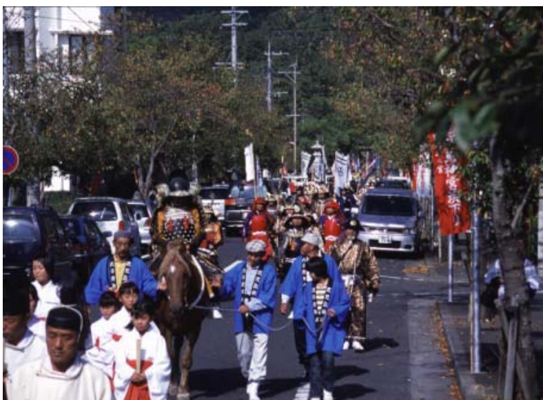
▲鹿児島神宮を出発する浜下り

平成12年、66年ぶりに復活した隼人浜下りが、10月16日に行われました。浜下りは、大分県の宇佐八幡宮が発祥の地です。奈良時代、大和朝廷によって殺された隼人族の霊を慰めるためにはじまりました。そして、いつしか鹿児島神宮でも行われるようになりました。鎧武者、鉄砲隊、剣道スポー