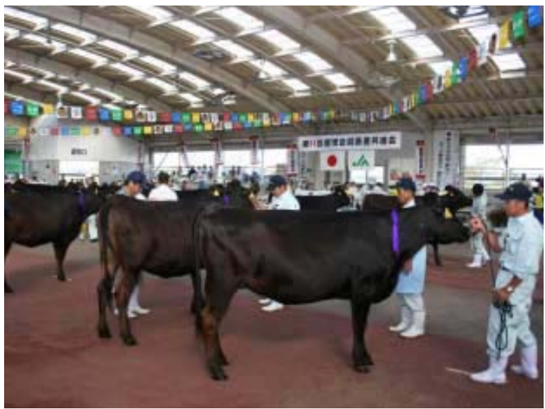
▲ただいま審査中。牛たちも緊張してます？

10月6日・7日、曾於市大隅町の曾於中央家畜市場において鹿児島県畜産共進会が開催されました。これは、県内の畜産農家が飼育する肉用牛のなかから発育・品位等が優れた牛を一同に審査し、優れた牛を決定する催しですが、霧島市からも福山町・溝辺町・横川町・牧園町から9頭が始良郡代表として出品されました。