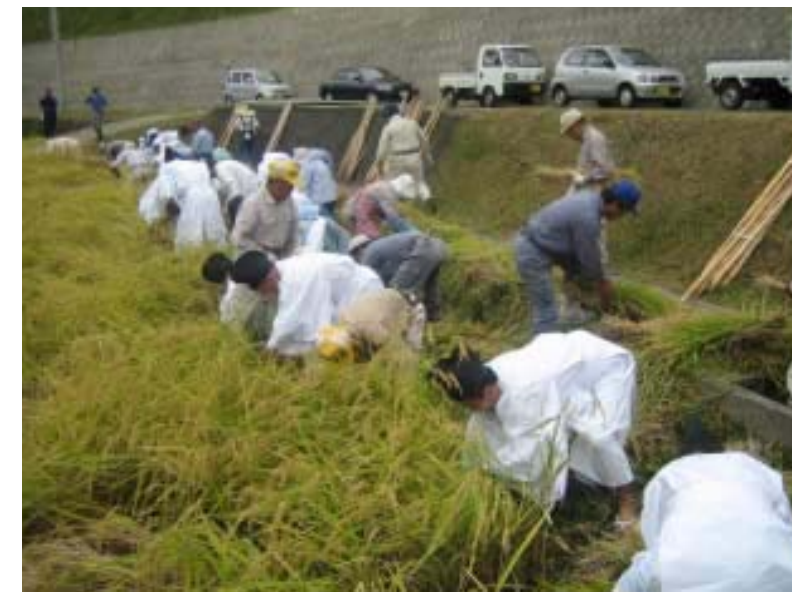
▲自然の恵みに感謝しながら稲刈り

10月2日、狭名田の長田において、狭名田地区長寿会や関係者ら約50人の手により抜穂祭(ぬいぼさい)がとり行われました。この抜穂祭は平成10年から続いており、6月に行われた長田のお田植祭で植え込まれた稲穂の全てを手作業で収穫するものです。今年9月初旬に上陸した台風14号の影響で、大半の稲穂が倒れてしまいました。参加された方々の手馴れた手つきのおかげもあって、作業は1時間ほどで終了しました。今回、収穫された稲穂は乾燥した後、霧島神宮へ奉納されます。