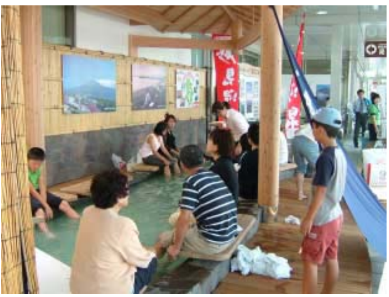
▲足がかかるーくなって飛びじゃいそう

9月24日、25日の両日、「空の日」を記念して2005空の日フェスティバルが鹿児島空港で行われました。空港ビル内を中心に、キャラクターショーや航空教室、エアライングッズの特別販売などがあり、多くの方が訪れていました。地元溝辺町と隼人町からは、霧島市誕生を記念して、「温泉三昧霧島の旅」と銘打って観光PRの特設会場を設置、その横