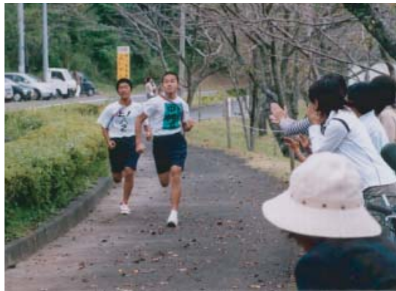
▲大きな声援を受け力走する選手たち

第42回横川町ブロック対抗駅伝競走大会が、10月10日、丸岡公園周回コース(10区間=15km)で行われました。この大会は、町内の各地域を8つのブロックに分け、ブロック間の交流と町民の体力増進を目的に、毎年、行われており、横川町の恒例行事となっています。レースは序盤から中盤まで上ノ地区Aチームと中ノ中央区A