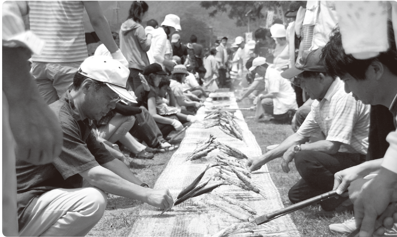
塩焼きに興味津々（一昨年の鮎まつり）