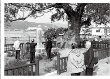
国分新町地区の人々に愛されてきた史跡「この杜」の整備工事が終了、その落成式が1月13日に行われました。