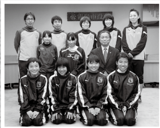
第3回びわ湖カップなでしこサッカー大会(小学6年生以下の女子)に出場する鹿児島県選抜で霧島市出身の選手とコーチが1月24日、霧島市を表敬訪問しました。