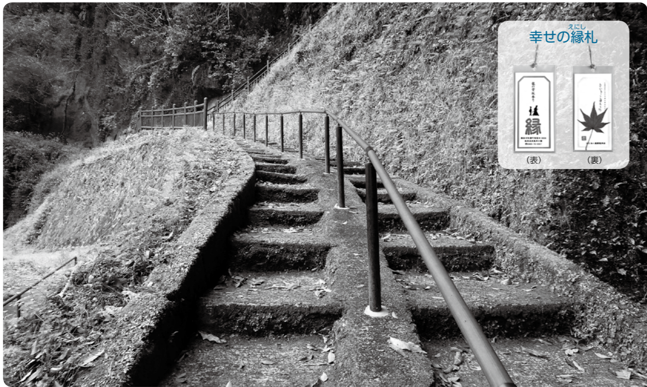
塩浸温泉龍馬公園にある108段の石段「龍の背坂」