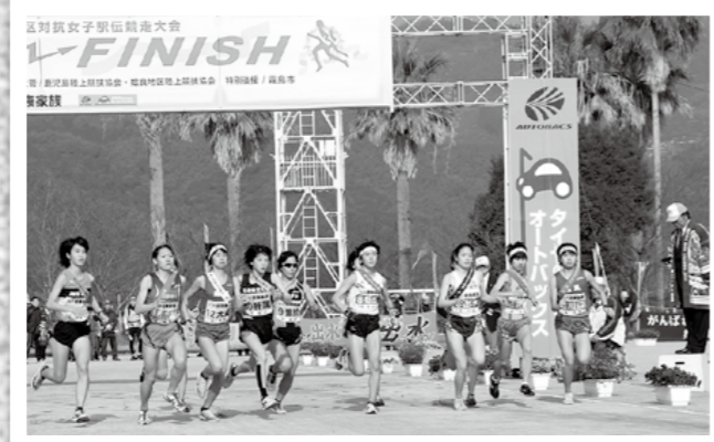
県地区対抗女子駅伝競走大会が1月26日、隼人運動場から国分下井までの往復6区間、21.0975*のコースで行われ、始発は12チーム中6位でした。