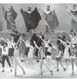
「大隅浪漫〜1300年の時空を超えて〜」2013公演の様子

◎ 納付の際は、納付書の期別をご確認ください。 ※ 期別を間違えて納付すると、未納となり督促状が届く場合があります。