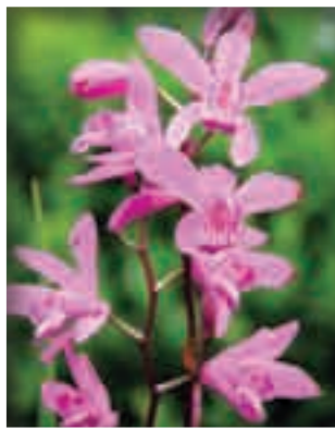
シラン(紫蘭)ラン科

お便りをくださったかたの中から米徳養蜂園の霧島産レンゲのはちみつ(1.2kg)を5人のかたにプレゼント。応募締め切りは5月22日(金)当日消印有効です。当選の発表は、商品の発送を持ってかえさせていただきます。