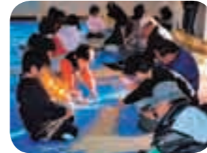
地域の高齢者と一緒に正月用のしめ縄を作製