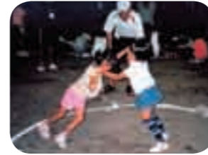
十五夜は今でも多くの子ども会で行われています