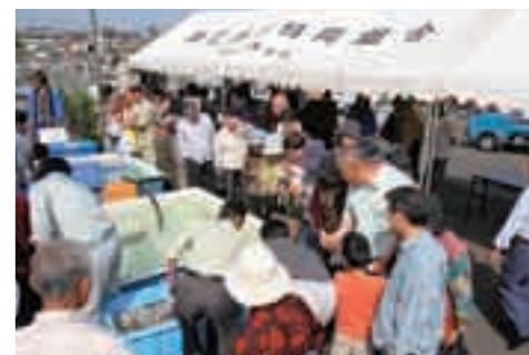
生きのいい魚を求めていけすの周りには大勢の人が集まりました