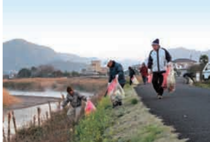
清掃作業に参加する住民の皆さん