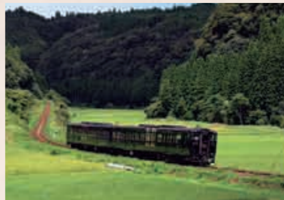
はやとの風（中福良～表木山間）

さて、霧島市に新幹線は走っていないが、鹿児島から宮崎、大分、小倉を結ぶ日豊本線と、隼人、吉松、人吉、八代を結ぶ肥薩線があります。市内の駅としては、日豊本線は隼人、国分、霧島神宮、北永野田、肥薩線は隼人、日当山、表木山、中福良、嘉例川、