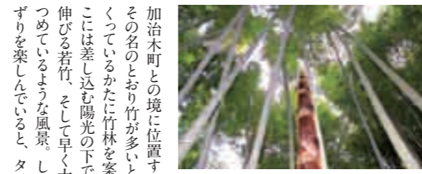
◎今月の表紙 4月20日 午後2時32分 溝辺町有川竹山地区(竹林の若竹)

※読者プレゼントを提供して下さるかたを募集しています。広報広聴課広報グループ ☎(64) 0955 までご連絡ください。