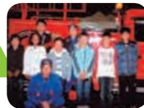
年末には消防団員と一緒に火の用心を呼びかけます