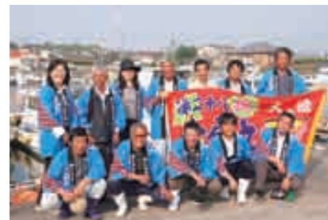
盛況のうちに第3回目の鮮魚青空市を終わらせた青壮年部員と漁協の皆さん