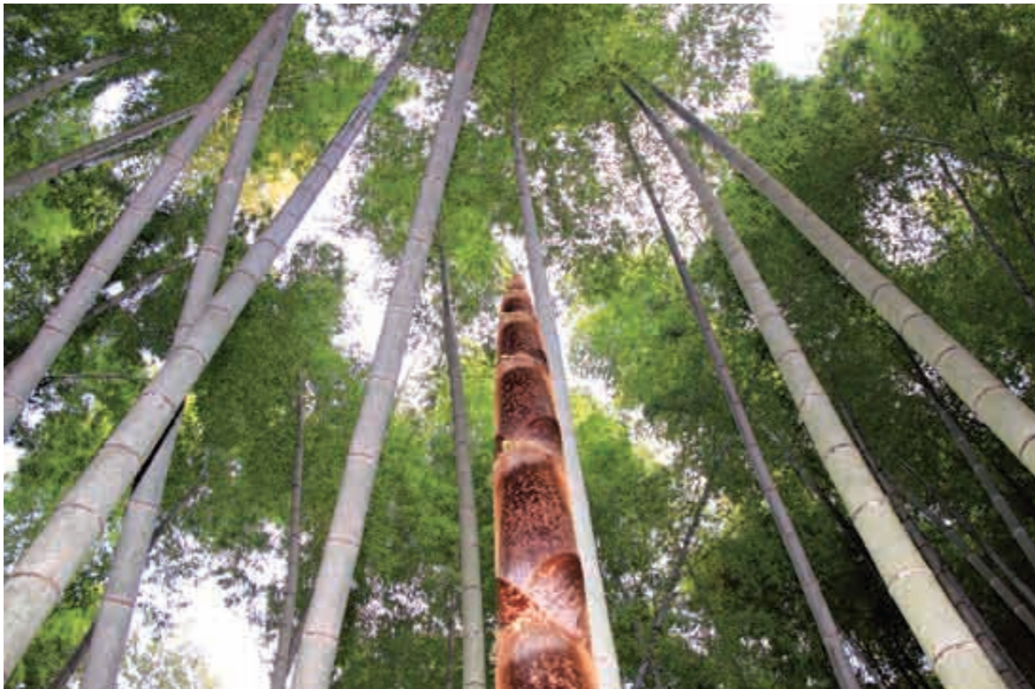
4月20日 午後2時32分 溝辺町有川竹山地区(竹林の若竹)

Special Edition 特集◎ ① みんなで支えるふれあいバス ② ミヤマキリシマ命名100周年 ③ 子どもの声が地域を照らす