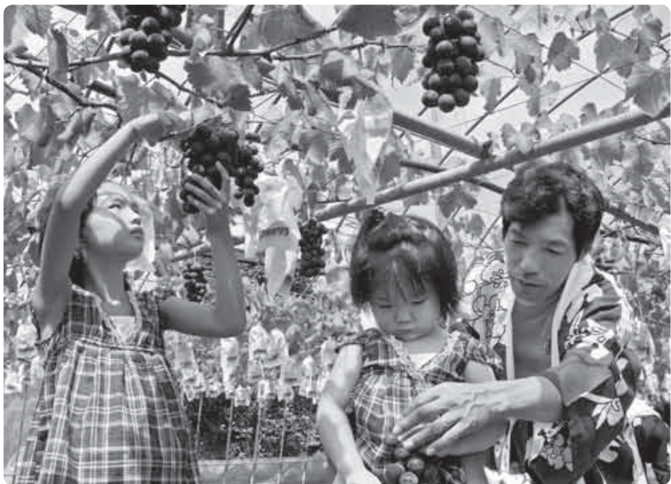
霧島市の観光農園ではブドウとナシが食べごろを迎え、8月6日に国分観光農園で開園式がありました(写真はまつもと観光農園)

◎問い合わせ先＝農政畜産課 ☎(64) 0910、または市ホームページに掲載している各農園にお問い合わせください