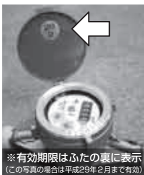
※有効期限はふたの裏に表示(この写真の場合は平成29年2月まで有効)

● 日時 9月20日(日) 一般開放 午前8時30分～午後3時30分 ● 場所 陸上自衛隊国分駐屯地 ● 内容 式典・観閲式、音楽演奏・格闘訓練、体験試乗・レンジャーロープ体験、ゲームコーナー、フリーマーケットなど ● フリーマーケット出店者募集(1枠3名×2名) ● 申込期限 9月4日(金) ● 申込者多数の場合は抽選 ● 申込・問い合わせ先 国分駐屯地 ☎(46) 0350