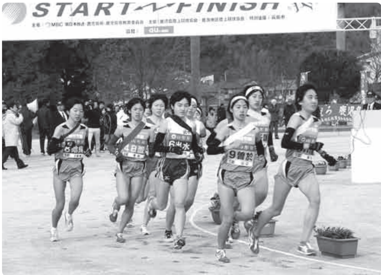
地域の期待を胸にスタートする選手たち(昨年のスタートの様子)