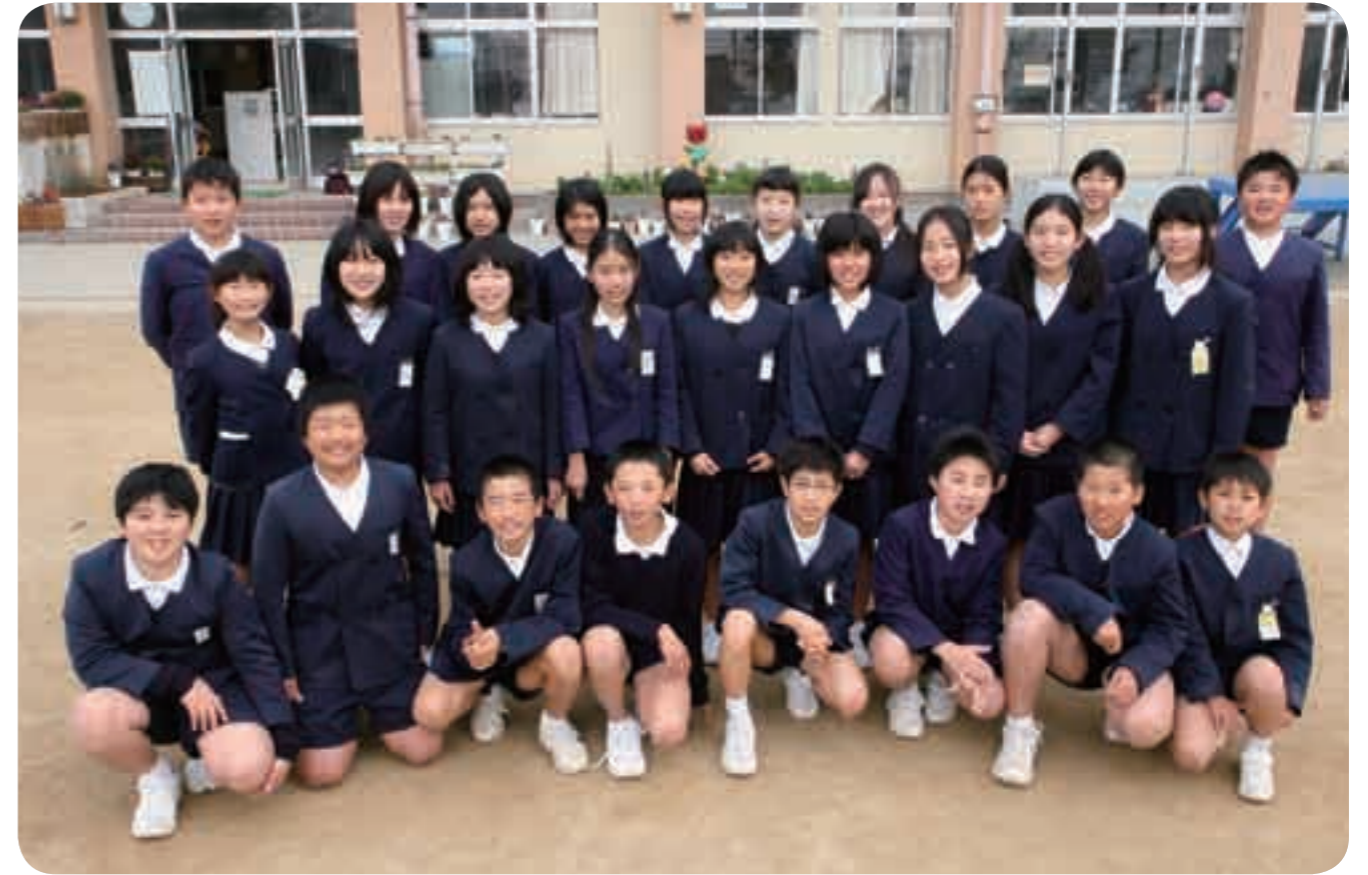
鹿児島弁を使った劇を披露した6年生

隼人町にある小野小学校は明治17年に創立され、現在198人(男子91人、女子107人)の児童が学んでいます。同校は地域の高齢者などとの交流が盛んです。中でも小野地区の地域活動団体が主催する校区を歩くウォークラリーは、自分たちが住む地域を知るいい機会となっています。