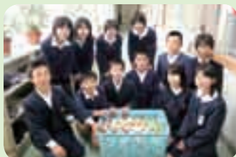
陵南小学校(溝辺) ペットボトルのキャップでワクチン支援