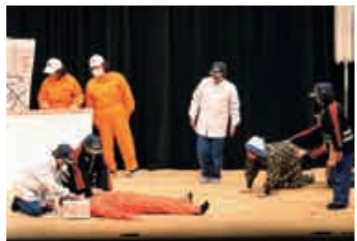
AEDの使用を劇で紹介する福山女性消防団員

市の成人式が1月3日と5日に市内7か所の会場で開催されました。今年、成人を迎えたのは平成元年4月2日から平成2年4月1日までに生まれた方で、霧島市では1917人(男1017人、女900人)の方が成人を迎えました。