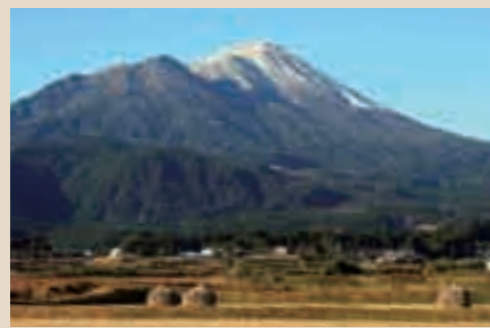
高原町から見た高千穂峰

ています。天の逆錐のある山頂が高千穂峰火山で、今から5000年くらい前に形成されたと考えられています。とがった山頂部は溶岩ドームでできており、火口はその溶岩に埋め立てられて見ることができません。