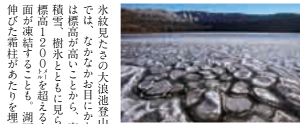
水紋見たさの大浪池登山。南国鹿児島市の平地では、なかなかお目にかかれませんが、霧島連山は標高が高いため、寒気団がやってくる。積雪、樹氷ともに見られることがありますが、標高1200mを超える大浪池の湖面では、全面が凍結することも。湖面周辺では、10数センチに伸びた霜柱があたりを埋めつくしていました。

※読者プレゼントを提供して下さる方を募集しています。広報広聴課広報グループ ☎(64) 0955 までご連絡ください。