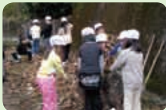
中津川小学校(牧園) 堆肥を作るための落ち葉集め