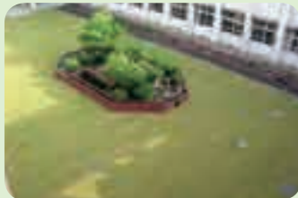
隼人中学校(隼人) 生徒が植えた中庭の芝生