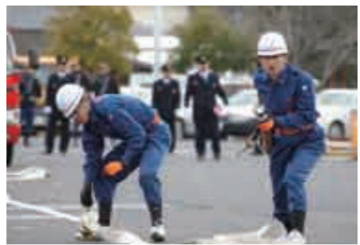
各方面隊がポンプ操作を披露