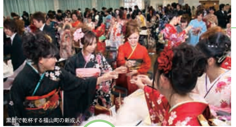
黒酢で乾杯する福山町の新成人

市の成人式が1月3日と5日に市内7か所の会場で開催されました。今年、成人を迎えたのは平成元年4月2日から平成2年4月1日までに生まれた方で、霧島市では1917人(男1017人、女900人)の方が成人を迎えました。