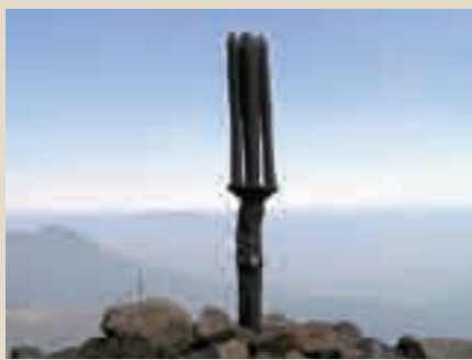
高千穂峰の山頂に立つ天の逆錐