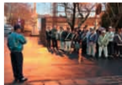
反射材の重要性を体感する参加者

現在、空前の健康ブームとされていますが、実際の日本の健康状態は、1,620万人の糖尿病患者や心臓病、脳血管疾患患者を抱える『生活習慣病大国』です。これは、社会の変化に伴い生活習慣が大きく変わってきたことと関係があります。長い間の不健康な生活習慣の積み重ねにより徐々に進行するのが特徴で、初期にはほとんど自覚症状はありません。発症すると取り返しのつかないことがしばしばですが、健康的な生活習慣を身につけることで予防することができます。 一人一人が『運動』『食生活』『心の休養』『飲酒』『喫煙』という生活習慣を改善し、社会全体へも広げる必要があります。その中で、運動としてのウォーキングはいつでも、どこでも、だれでも気軽にすることができ、さらに効率よく内臓脂肪を減らすための効果が大きいのでお勧めです。また、ウォーキングを続けていくことで皮膚の新陳代謝が高まり、美肌になったり適度に減量することで美しい身体になります。ぜひ、10分間でもウォーキングを生活の中に取り入れてみましょう。