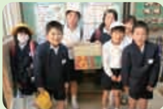
安良(やすら)小学校(横川) ウサギ募金箱の設置