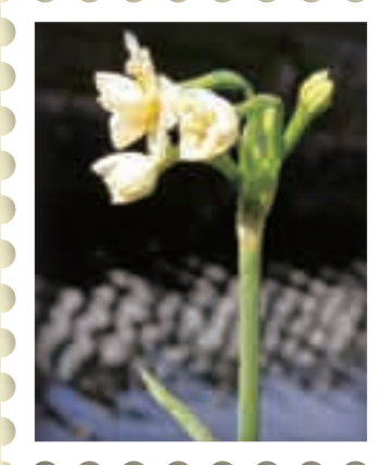
スイセン(ヒガンバナ科)