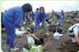
福山中学校(福山) ドングリを育て、桜島に植樹