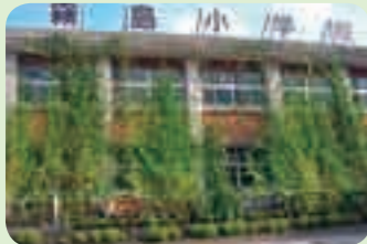
霧島小学校(霧島) おやじの会が緑のカーテンを設置