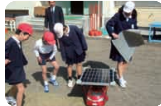
京セラ国分工場と隼人工場は環境出前講座を実施。昨年は市内の小・中学校14校で環境教室を開催。国分の平山小学校ではソーラーカーなどを使いその仕組みを紹介。