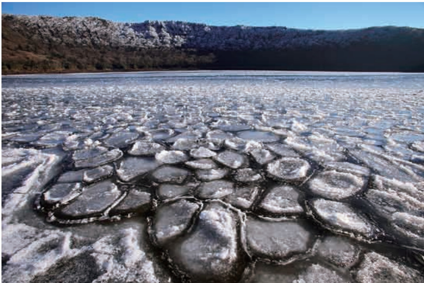
おおなるのいけ 大浪池の氷紋 1月9日 午後3時38分

Kirishima City Public Relations, Japan 2010.2.9 発行 VOL.93