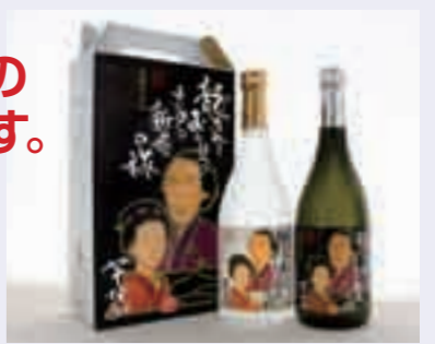
お酒は20歳になってから。

日本で初めての新婚旅行をしたとされる坂本龍馬と妻おりょうが訪れた霧島。二人の新婚旅行に想いをはせながら飲んでいただく、霧島山系のやわらかい地下水で仕込んだ芋焼酎。白麹仕込みの「さつま国分」と黒麹仕込みの「黒石岳」、お湯割り、水割り、ロックなどお好みで白と黒の飲み比べをお楽しみください。県内限定商品 希望小売価格720 円 ×2本セット2,500円(税込) ◎問い合わせ先=国分酒造協業組合 ☎47-2361 http://www.kokubu-imo.com/ 国分酒造は、社会貢献の一環として、一升ビン1本につき1円を寄付しています。