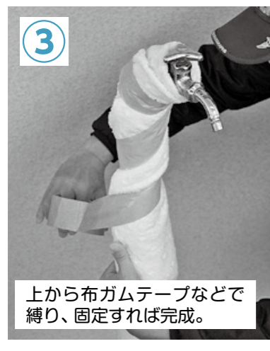
③ 上から布ガムテープなどで縛り、固定すれば完成。