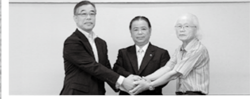
地域における見守り活動に関する協力協定調印式

→市内の見守り活動の協力連携を目的に10月21日、生活協同組合コープかごしま、市民生委員児童委員協議会連合会と市が協定を締結しました。