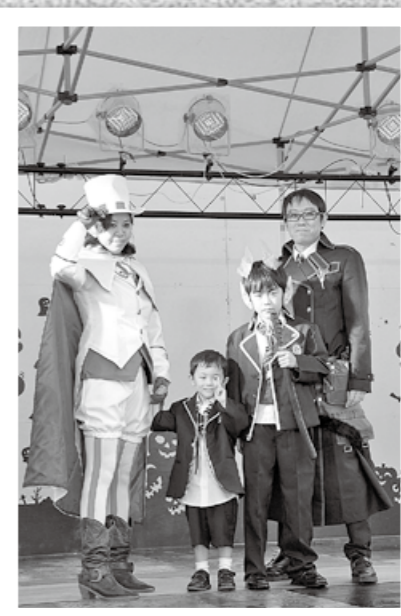
↑お化けやアニメキャラクターなど思い思いの仮装を楽しむ「KIRISHIMA ハッピー・ハロウィン3rd」が10月22、23日、国分シビックセンターお祭り広場でありました。