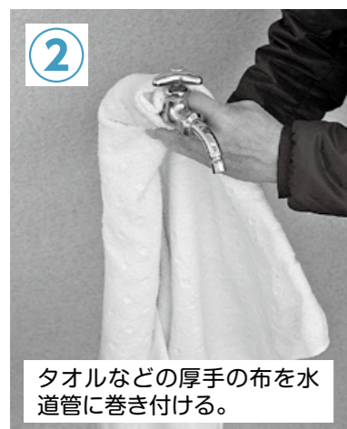
② タオルなどの厚手の布を水道管に巻き付ける。