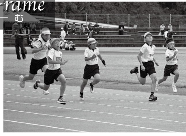
↑市小学校陸上記録会が10月12日、国分運動公園陸上競技場であり、市内の小学5・6年生の代表約600人が100m走り高跳びなど5種目で競い合いました。

隼人浜下りが10月16日にあり、よろい武者や神官、稚児など370人が鹿児島神宮から浜之市八幡屋敷まで約4kmを練り歩きました。↓