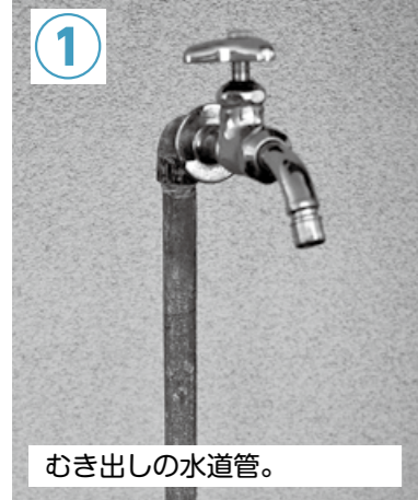
① むき出しの水道管。