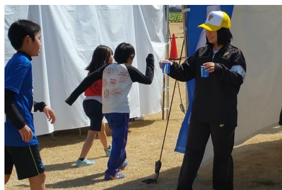
スポーツボランティア (霧島市・上野原縄文の森駅伝大会)