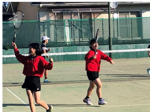
NPO法人隼人錦江スポーツクラブ (総合型地域スポーツクラブ)