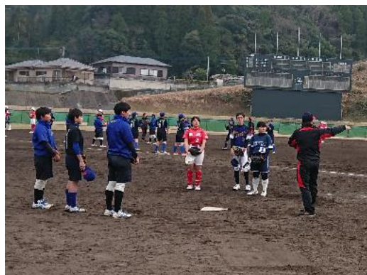
ソフトボール教室（太陽誘電ソルフィーユ）