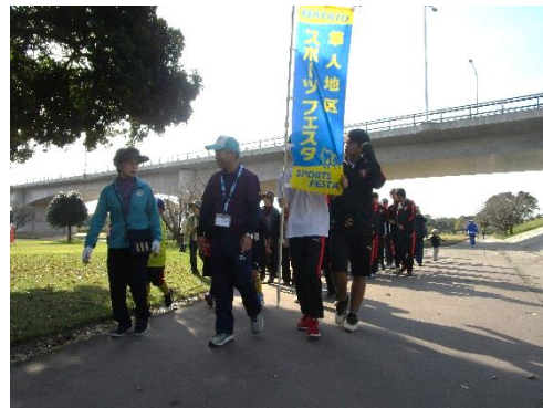
隼人地区スポーツフェスタ ウォーキング大会 (地区スポーツ祭)