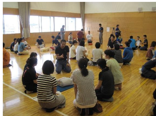
霧島市スポーツ少年団指導者研修会 (AED講習)