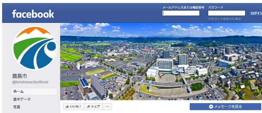
霧島市公式フェイスブック