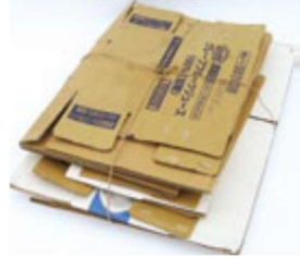
박스 테이프, 스테이플러, 송장 등은 제거한다