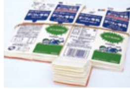
종이 팩 씻어 펼친 팩 을 말려서 배출. 만약 코팅이 되어있다면 가연성 쓰레기로 배출