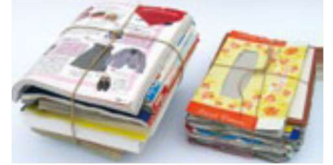
과자 상자, 포장지, 프린트 용지(감열지 제외), 티슈 상자, 카탈로그, 엽서, 종이봉투 등