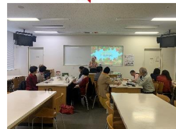
サンタクロースの帽子をかぶっているエマちゃんは可愛いですね！