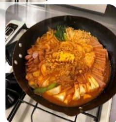
国際料理キッチン のレシピ