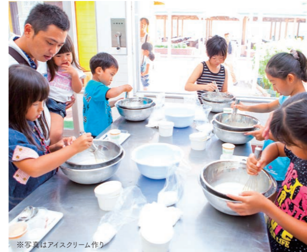
※写真はアイスクリーム作り

霧島で大人気の観光牧場「高千穂牧場」にて手作りの乳製品を作る体験です。「バター作り」「ソーセージ作り」「アイスクリーム作り」の他、施設内では動物とふれあうこともできます。