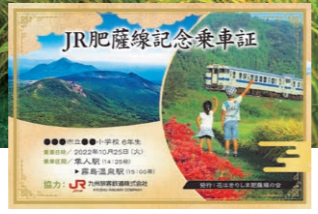
※実物はハガキサイズです。

【申込先】 霧島市役所牧園総合支所 地域振興課 〒899-6592 霧島市牧園町宿窪田791-1 TEL: 0995-76-2701