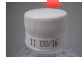
▲ 現在のペットボトル用 キャップ(白色無地)