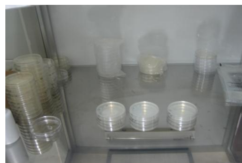
▲ 関平鉱泉所検査室 菌検査の様子 毎日鉱泉水の水質検査を行っています。