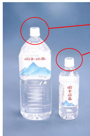
▲ 関平鉱泉水ペットボトル 2ℓ(左)・0.5ℓ(右)

ペットボトルキャップの白色無地化について再度お知らせします。東日本大震災の発生後からミネラルウォーターや清涼飲料の供給不足が続いていますが、キャップ不足を解消し商品の供給力をアップするため、飲料業界全体でペットボトルに使われているキャップを白色無地のデザインに切り替えております。キャップ共通化の期間は、被災キャップ工場が復旧し供給が整うまでと予定されております。