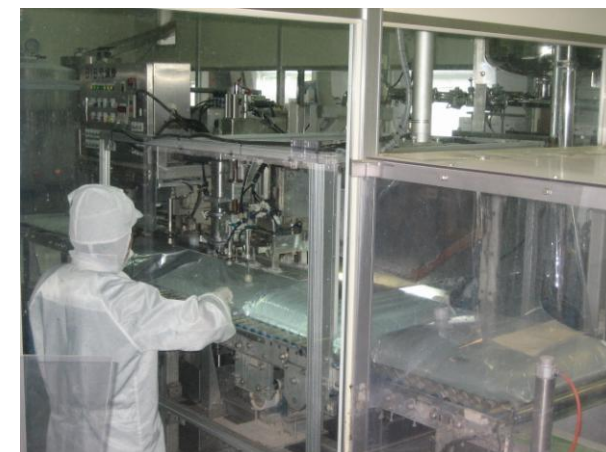
▲ 関平鉱泉水充填室＝20ℓパック製造風景 全自動充填機で衛生的に製造しております。