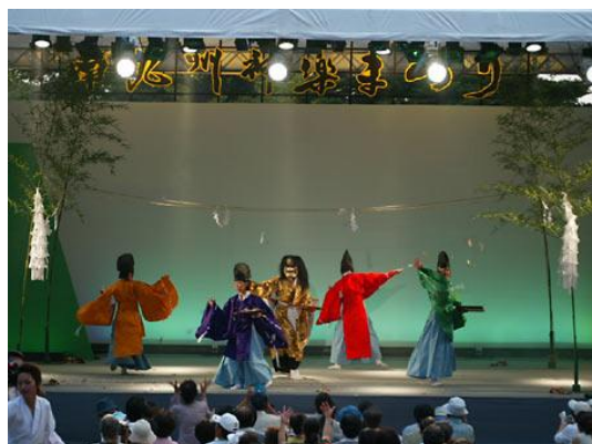
▲ 南九州神楽まつり 第6回天孫降臨霧島祭のお問い合わせ先 霧島市観光協会：0995-78-2115

日時=8/27(土) 開演=14時 場所=みやまコンセール 主ホール 第26回 霧島高原太鼓まつり 日時=8/28(日) 開演=17時30分 入場無料(前方有料席有り) 場所=みやまコンセール 野外音楽堂