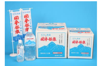
▲ 関平鉱泉水 全国発送承ります。

※ お歳暮用の「のし」も用意しておりますので、お気軽にお申し付けください。お申し込み=TEL0120-235-524