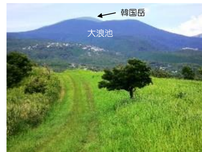
▲柳ヶ平自然散策路 命の洗濯場から望む霧島連山

親子で、お友達と大自然を堪能したら、お昼は手作りバイキングを堪能し、そして帰りはお土産に特産品買物券をプレゼント。