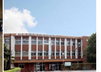
県立福山高等学校 通学費等支援事業