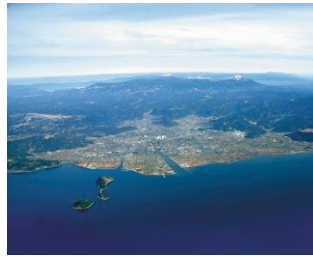
生活排水対策推進計画策定及び進行管理事業