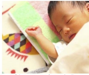
粉ミルク支給事業