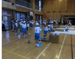
学校児童生徒の定期健 診・就学時健診事業