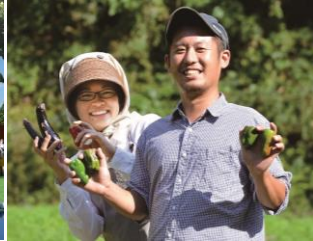
移住定住促進補助事業 （移住者への支援）