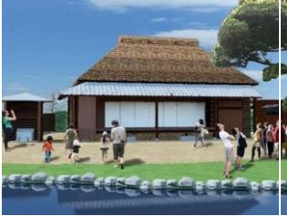
市内各種観光施設維持管理 総務事業（「西郷どんの宿」）