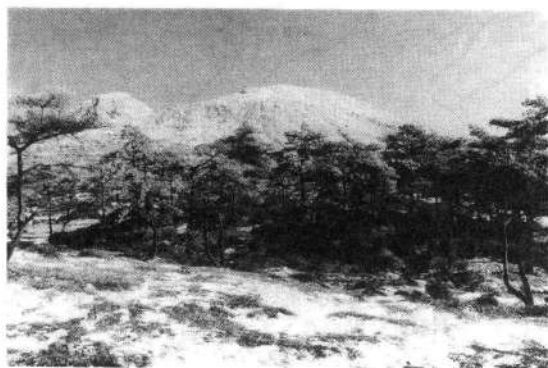
霧 島 山

本町は総面積一二・九六五ヘクタールで、その広さは郡内一位、県下町村（市を除く）第九位で、吉松町の約二・四倍、溝辺町の二倍、横川町の一・八倍の広さをも