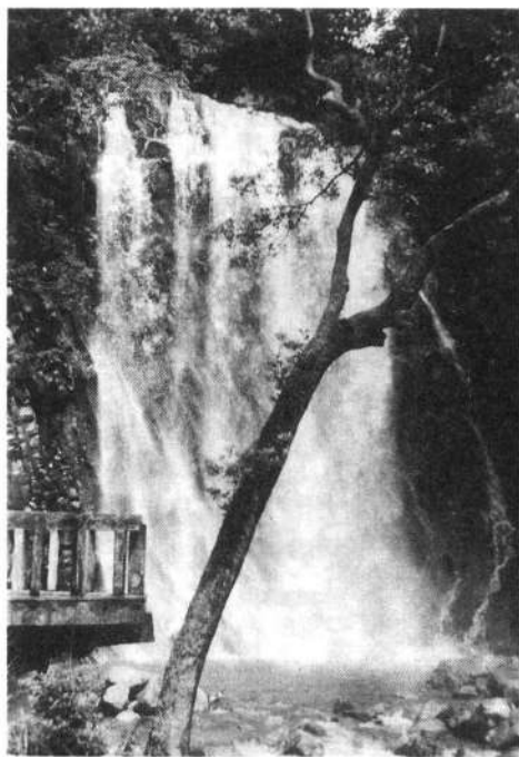
丸 尾 の 滝

牧園町北西佐賀利山の北方、東方に源を発している万膳川・三休川及び大浪池のすそから流出している石坂川・小谷川・中津川は激しい浸食を起こし、この地域に変動を与え、複雑な地形をつくっている。中津川は上流において急流をなし、地盤の熔岩をうがち丸尾の滝（安山岩の柱状節理がみられる）をつくり、笹之段で前方が開け平地となる。この支流である小谷川が霧島街道に沿い牧場を流れ、轟木付近から灰砂層の上を流れ深い谷をつく