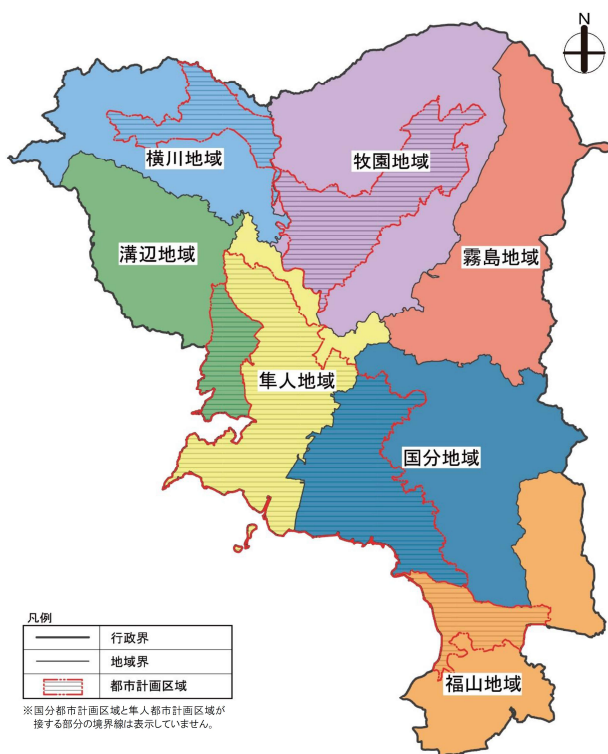
図 1-2 計画区域

なお、都市計画マスタープランにおいて各地域の総合支所周辺に地域拠点を設定しているが、都市計画区域外である溝辺地域と霧島地域は、「地域生活拠点」としても設定する。